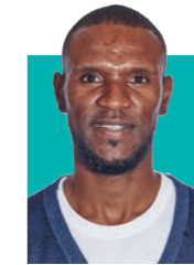
Eric ABIDAL ANCIEN DIRECTEUR SPORTIF, FC BARCELONA PROMOTION 1

"Ce programme m'a permis de m'épanouir tant sur le plan personnel que professionnel. J'ai réalisé combien les compétences que j'ai acquises en tant que joueuse professionnelle sont importantes et transposables en compétences managériales"