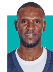
Eric ABIDAL ANCIEN DIRECTEUR SPORTIF, FC BARCELONA PROMOTION 1

"Ce programme m'a permis de m'épanouir tant sur le plan personnel que professionnel. J'ai réalisé combien les compétences que j'ai acquises en tant que joueuse professionnelle sont importantes et transposables en compétences managériales"