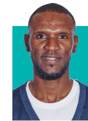
Eric ABIDAL ANCIEN DIRECTEUR SPORTIF, FC BARCELONA PROMOTION 1

"Ce programme m'a permis de m'épanouir tant sur le plan personnel que professionnel. J'ai réalisé combien les compétences que j'ai acquises en tant que joueuse professionnelle sont importantes et transposables en compétences managériales"