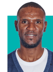
Eric ABIDAL ANCIEN DIRECTEUR SPORTIF, FC BARCELONA PROMOTION 1

"Ce programme m'a permis de m'épanouir tant sur le plan personnel que professionnel. J'ai réalisé combien les compétences que j'ai acquises en tant que joueuse professionnelle sont importantes et transposables en compétences managériales"