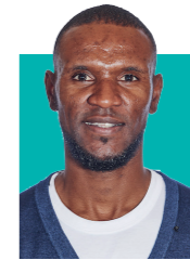
Eric ABIDAL ANCIEN DIRECTEUR SPORTIF, FC BARCELONA PROMOTION 1

"Ce programme m'a permis de m'épanouir tant sur le plan personnel que professionnel. J'ai réalisé combien les compétences que j'ai acquises en tant que joueuse professionnelle sont importantes et transposables en compétences managériales"